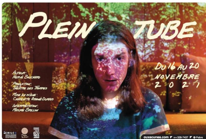
Affiche officielle du spectacle.

«Ça nous rend un peu champ gauche , mais c'est ça qui fait notre force en tant que compagnie et en tant qu'artistes. Notre travail est basé avant tout sur nos valeurs féministes et sur notre démarche hybride, mêlant différentes approches et différents arts. Le cinéma a une grande influence sur notre travail et nos référents, surtout pour Antoine et moi.»